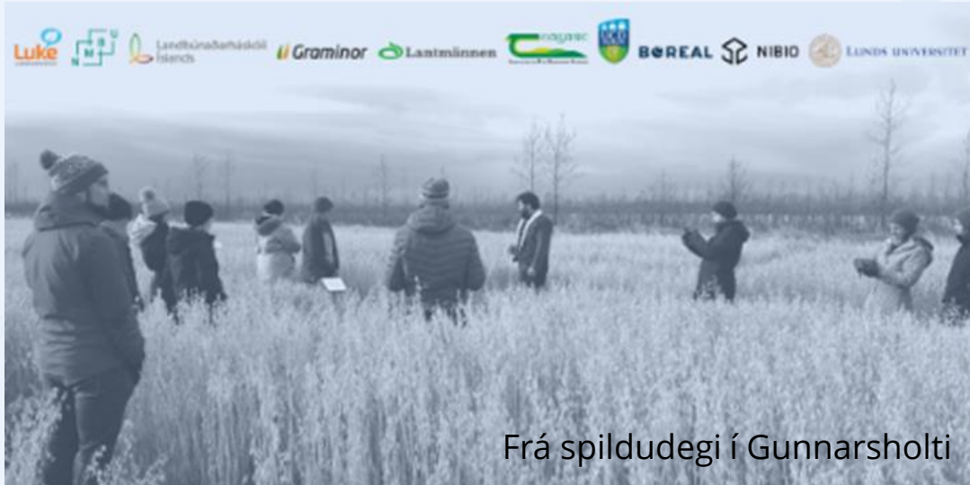
Frá spildudegi í Gunnarsholti