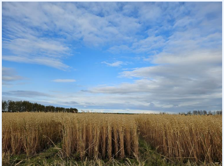
Hafrar í Gunnarsholti.

Á Íslandi er það Landbúnaðarháskóli Íslands sem tekur þátt í verkefninu sem er unnið við Jarðræktarmiðstöð Lbhí. Tilraunir eru á Hvanneyri í Andakíl og í Gunnarsholti á Rangárvöllum þar sem tilraunirnar verða til sýnis.